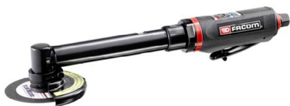
V.CE100F Facom vinkelkutter lang 100mm