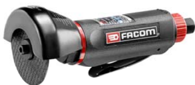
V.C75F Facom vinkelkutter 75mm.