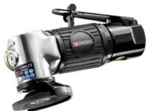
V.AG50F Facom liten vinkelsliper 50mm.